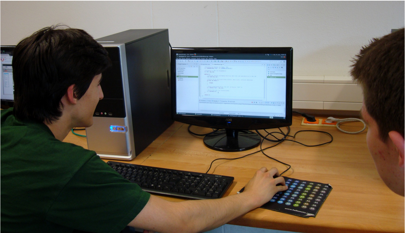
Abbildung 2: Digitale Medien werden am GBG bereits in vielen Zusammenhängen verwendet.

Medienpädagogische Aktivitäten sind bereits in vielen Zusammenhängen am GBG zu finden. Hier ist insbesondere der Wahlpflichtunterricht „Informatik & Soziales“ in Jahrgang 8 zu nennen, in dessen Rahmen bereits grundlegende Kenntnisse über Hard- und Software vermittelt werden. Zudem soll dieser Wahlpflichtunterricht allen Schülerinnen und Schülern einen ersten Zugang zur Informatik bieten, indem einfache Algorithmen mit der visuellen Programmiersprache „Scratch“ entwickelt werden. Ein verbindliches Curriculum für den Wahlpflichtunterricht „Informatik & Soziales“ findet sich im Anhang.