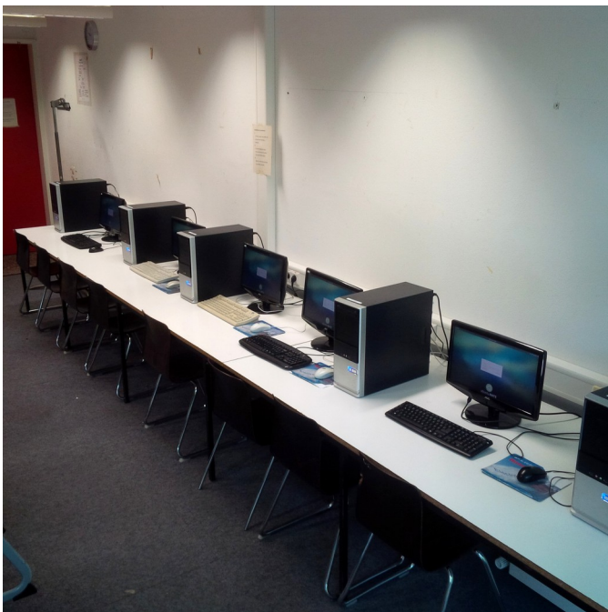
Abbildung 3: Computerarbeitsplätze in Raum E31

Derzeit verfügt das Georg-Büchner-Gymnasium über drei Computerräume (E30, E31 und 501) mit jeweils rund 15 Computern und über einen Kunstraum mit sechs Computerarbeitsplätzen (E44). Diese Computer verfügen alle über 64-Bit-Dual-Core-Prozessoren, über durchschnittlich zwischen zwei und vier GB Arbeitsspeicher, über eine Radeon-3000-Grafikkarte und werden mit Ubuntu 16.04 LTS betrieben. Das Alter der Geräte beträgt im Mittel etwa 8 Jahre. Auf allen Geräten sind mindestens das Office-Paket „LibreOffice“, das Vektorgrafikprogramm „Inkscape“, das Bildbearbeitungsprogramm „Gimp“, das Audioschnittprogramm „Audacity“, das Layoutprogramm „Scribus“, die dynamische Geometriesoftware GeoGebra, Videoschnittprogramme („OpenShot“ und „kdenlive“) sowie die Webbrowser „Firefox“ und „Chromium“ installiert. Über diese Programme hinaus sind weitere spezialisierte Anwendungen für den Informatikunterricht installiert. Die Computerräume E30, E31 und 501 sind über die IServ-Weboberfläche buchbar, sofern sie nicht für Informatik- oder Wahlpflichtunterricht geblockt sind. Häufig liegen die Kurse des Wahlpflichtunterrichts in einem Jahrgang zeitgleich. Dieses hat zur Folge, dass dementsprechend in den Doppelstunden, in denen Wahlpflichtunterricht stattfindet, die Buchbarkeit der Computerräume sehr eingeschränkt ist. So steht dann beispielsweise während bestimmter Doppelstunden nur ein Computer-